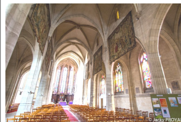
TABLEAU DES LITANIES DE LA VIERGE