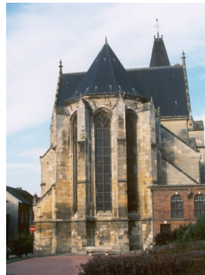
Rue Robert-Le-Coq Chevet de l'église du Saint-Sépulcre À droite, construite en brique, la sacristie