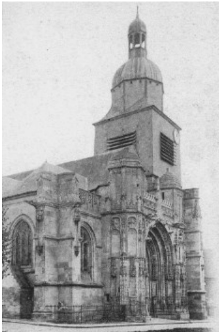
L'église Saint-Pierre au début du XX e siècle