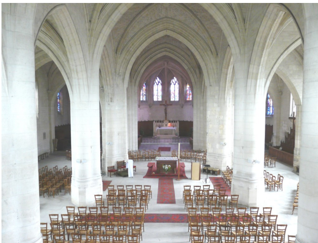
La nef et le chœur de l'église Saint-Pierre